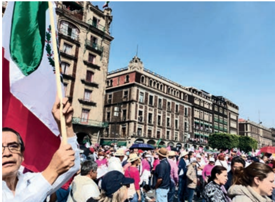
Marcha por nuestra democracia.

La plataforma del partido Morena para 2024-2030, ya suscrita por su candidata a la presidencia, promete una profunda remodelación del panorama político mexicano hacia un sistema “genuinamente democrático”. Se pretende continuar con el proyecto de la Cuarta Transformación mediante un enfoque revolucionario, arraigado en principios de izquierda y con el pueblo como protagonista activo. Este esfuerzo busca una transformación radical en el modo de gobernar, orientada a devolver la soberanía a la ciudadanía, en especial a aquellos en posiciones subalternas. ➤