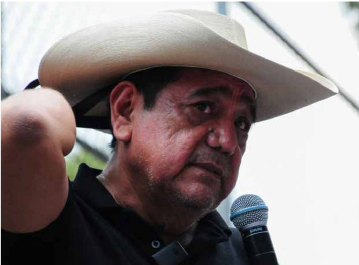
Fotografía: Captura de pantalla

Toda esta dinastía vinculada al PRI pero en los municipios la historia también se repite y en el caso de Tlalchapa, región Tierra Caliente, familia Mora Eguiluz ha mantenido en su poder la presidencia municipal, desde hace más de dos décadas con las siglas del PRD y Morena en periodo vigente.