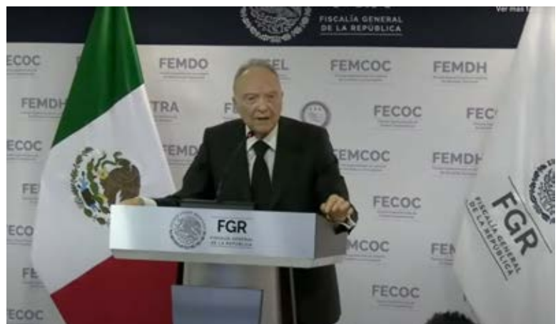
Fotografía: captura de pantalla.

¿Se asumirá realmente el compromiso de cumplir la ley y actuar? Sobre la base de la distancia que se coloca y mantiene para las personas familiares de las víctimas, los dichos en Palacio Nacional, el decreto y las iniciativas por conocerse son “palabras, palabras, todo palabras”. La verdad sin contenido. ✈