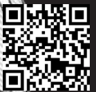
Ilustración: Pablo Quezada.