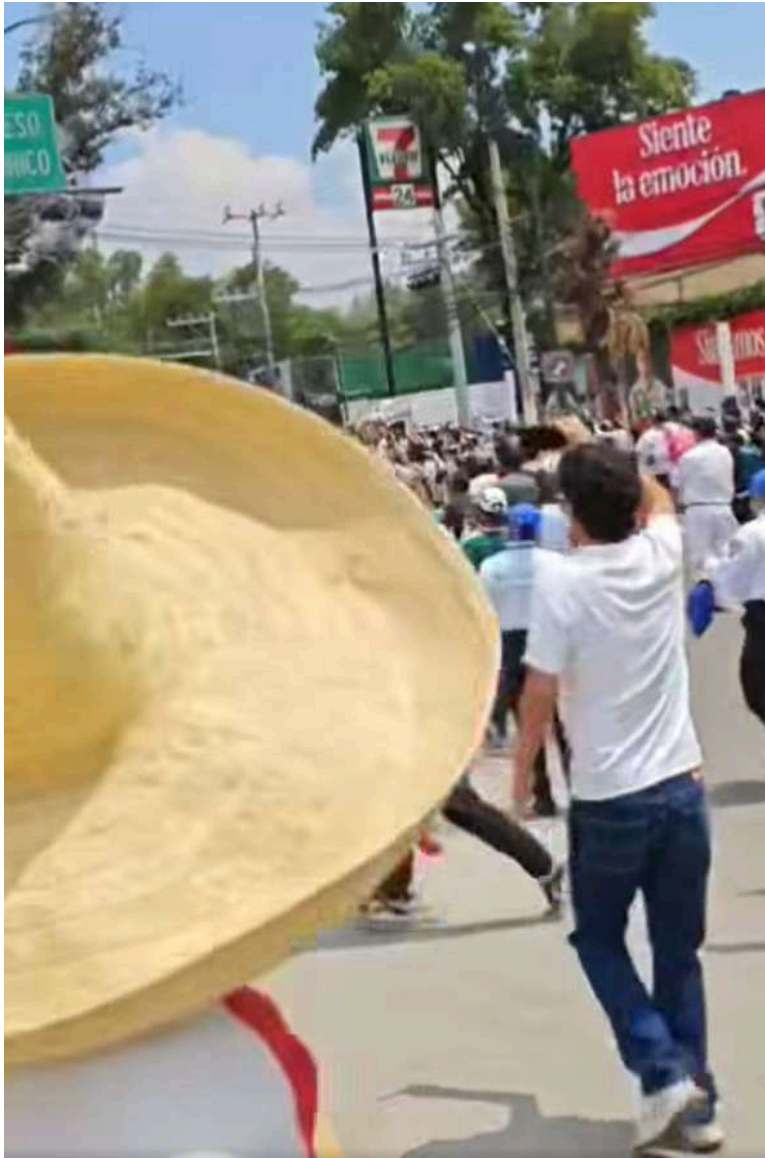
Fotografía: captura de pantalla.

Todos eufóricos, gritando “México, México, sí se pudo”, cantando el cieli-to lindo, con el Estadio